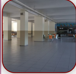
Kantin ve Yemekhanemiz