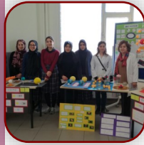
“Bilim Şenliği” Etkinliğimiz (Ortaokul/Lise)