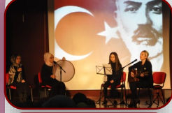
Tören ve Kutlamalar