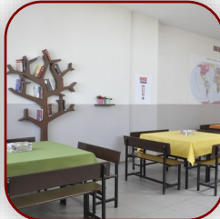
Hane-i Ders 2