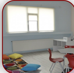
Özel Destek Odası