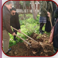
Cangözüm Projesi ile “İSTANBUL BAHÇESİ” çalışmamız