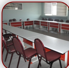
Çok Amaçlı Salon